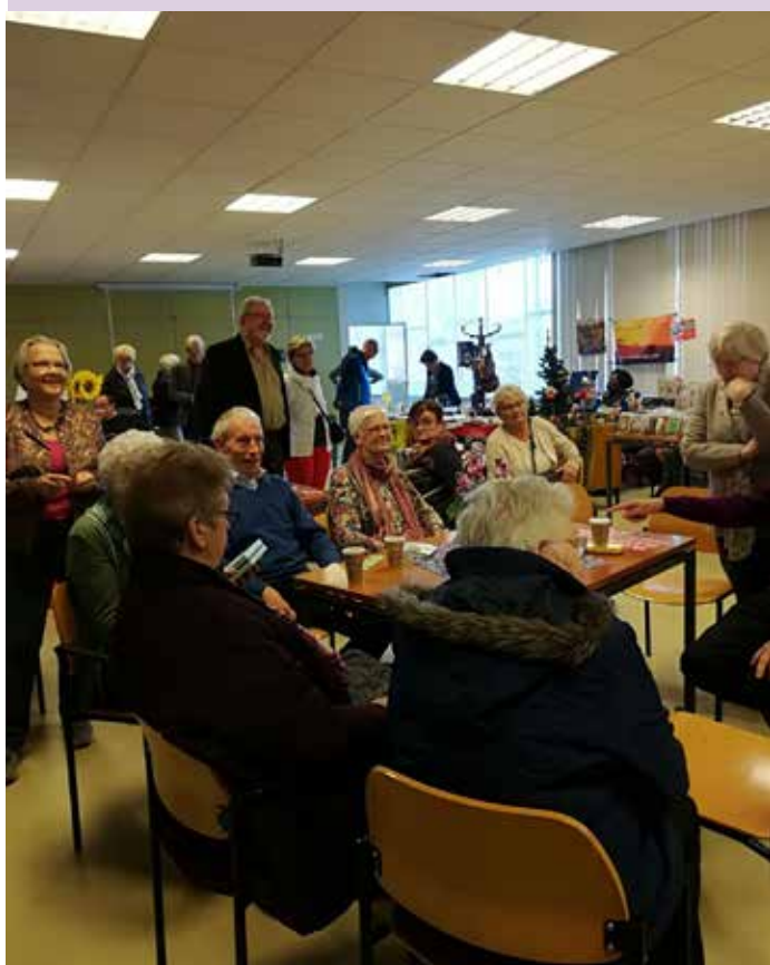
Een paar foto's van de fairtrade markt