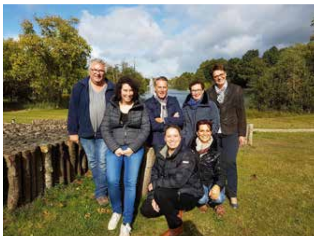
De huidige wijkraad Oss_Zuid