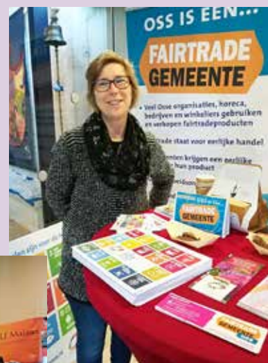
Het was een gezellige drukte