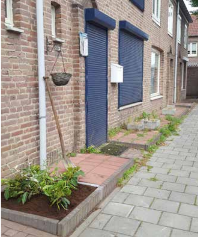
Zo was het

Hieronder een impressie van hoe het was en hoe het nu is.