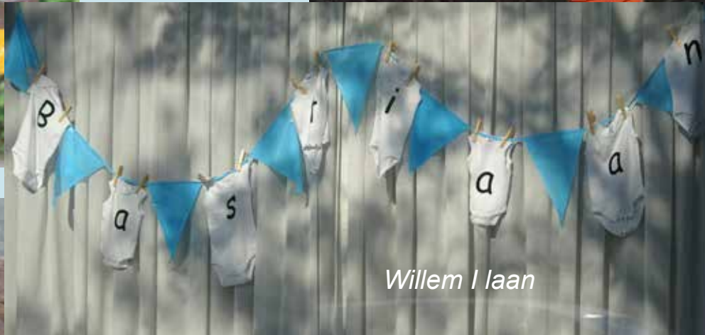
Willem I laan