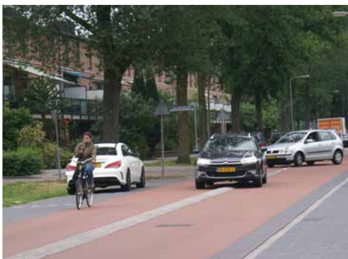
Zomaar een paar foto's van de fietsstraat op een doordeweekse dag