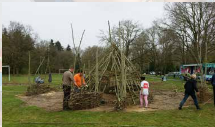
Samen op zaterdag aan de slag