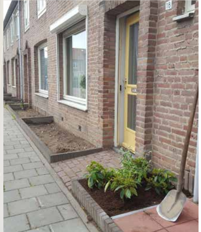
werk in uitvoering