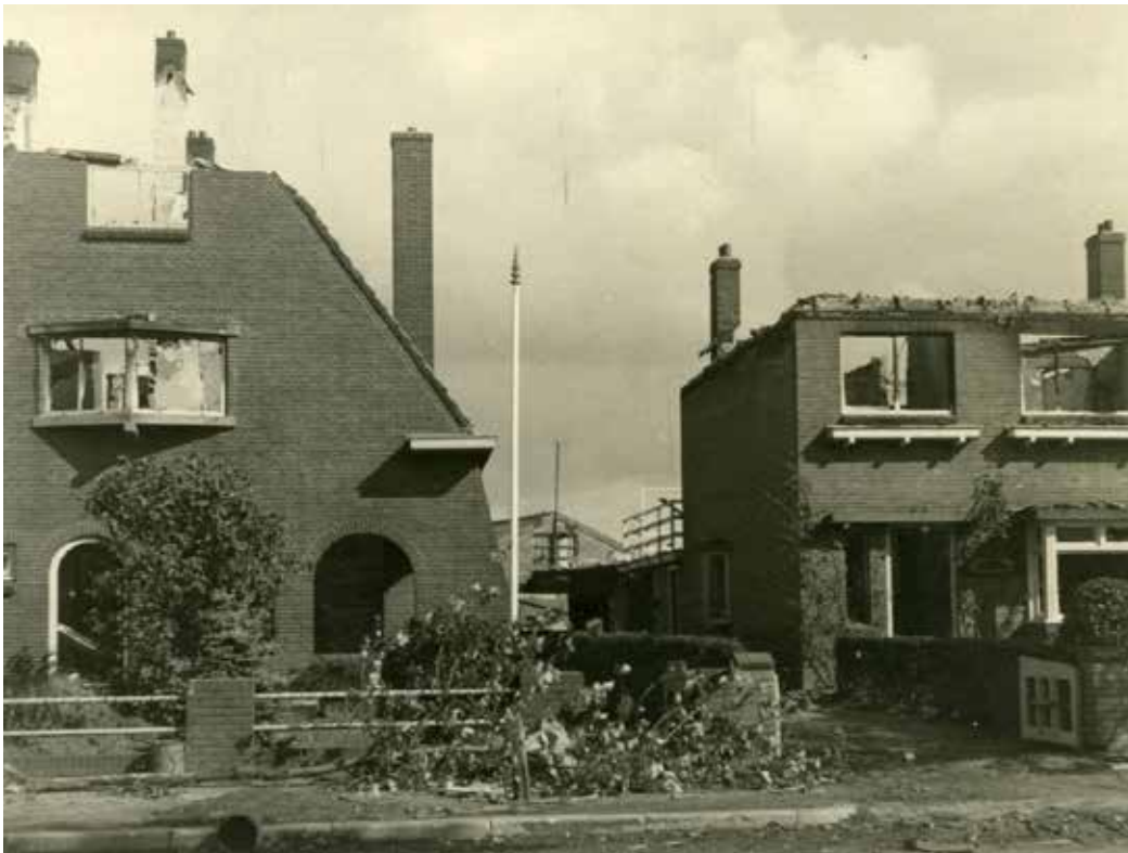
Verwoeste villa "De Ruwerd" (eigendom van de familie Van Loosbroek) aan de Hescheweg.