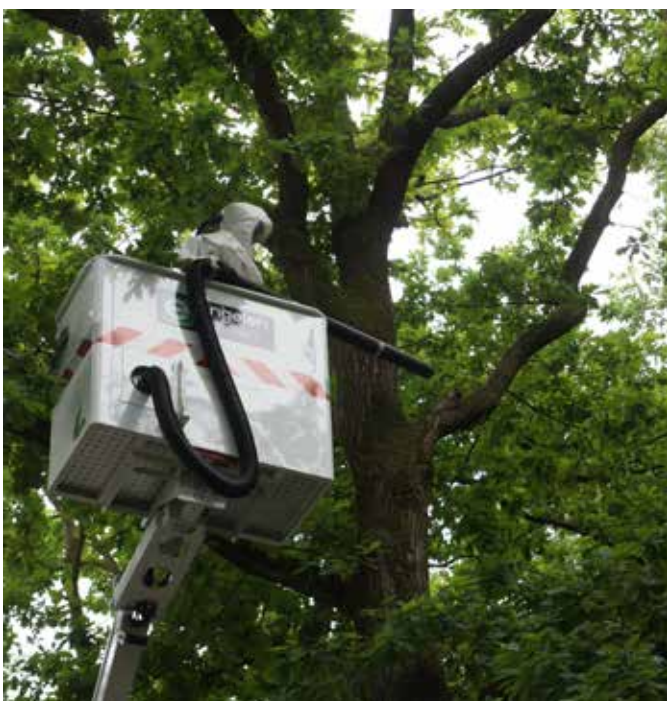
Wegzuigen, hoog in de boom.

Ziet u een nest met eikenprocessierupsen, dan kunt u dit melden bij de gemeente; www.oss.nl/melding De gemeente kiest voor het bestrijden van de rups door het wegzuigen van de nesten.