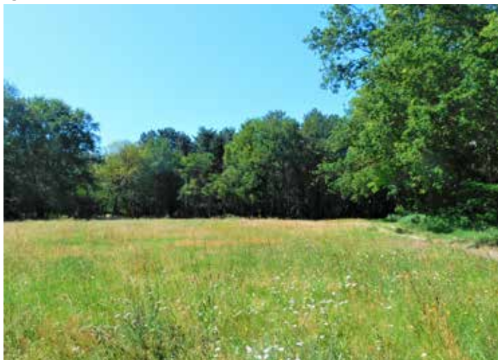
Één van de veldjes aan de Munlaan die nu bij landschapsbeheer in beheer zijn.