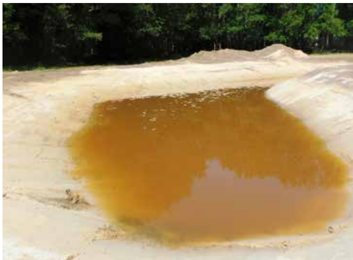
Een pas gegraven ven heeft zich gevuld met ijzerrijk grondwater.

De omringende houtwallen zijn opgeknapt, veel dood hout is op rillen gestapeld en er zijn een paar nieuwe houtsingels aangelegd.