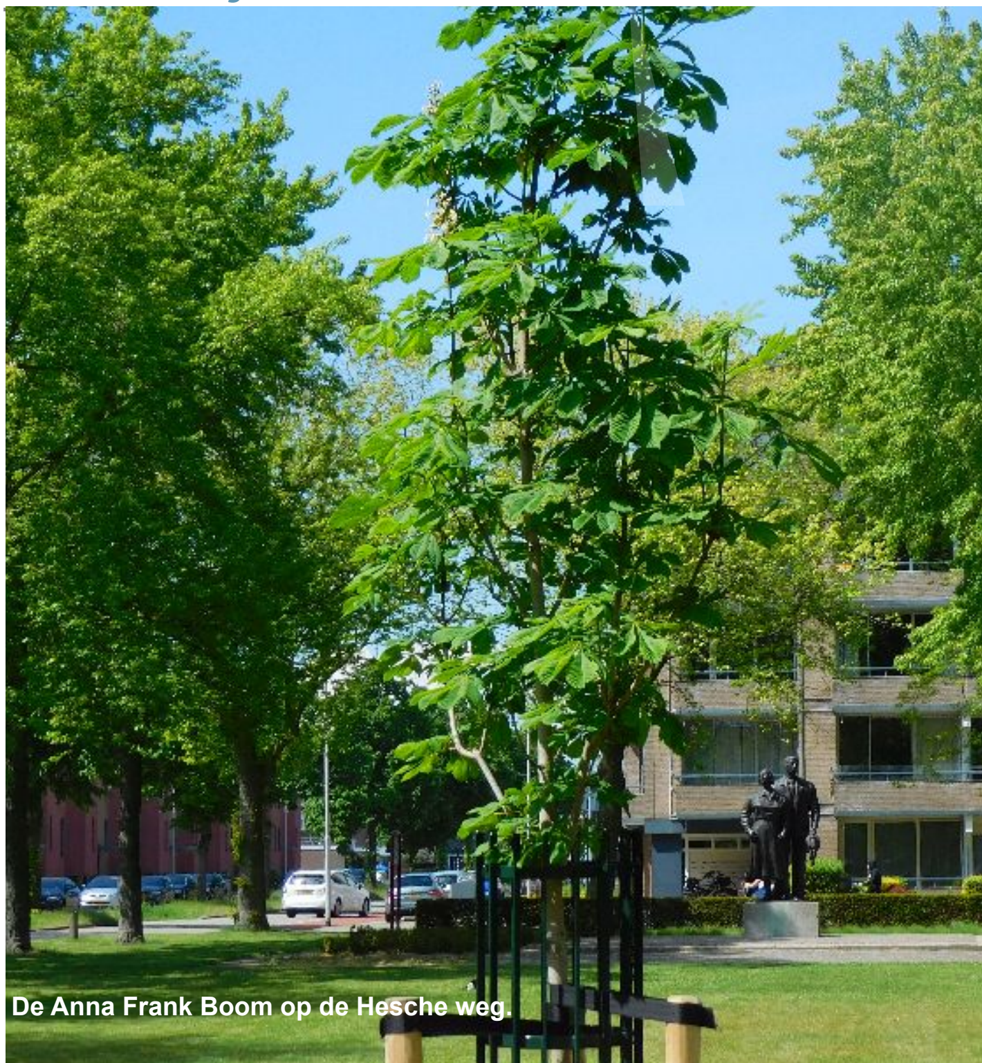
De Anna Frank Boom op de Hesche weg.